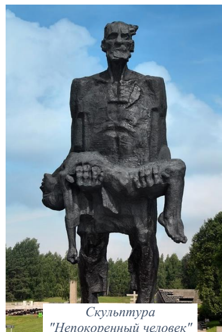
Скульптура "Непокоренный человек"