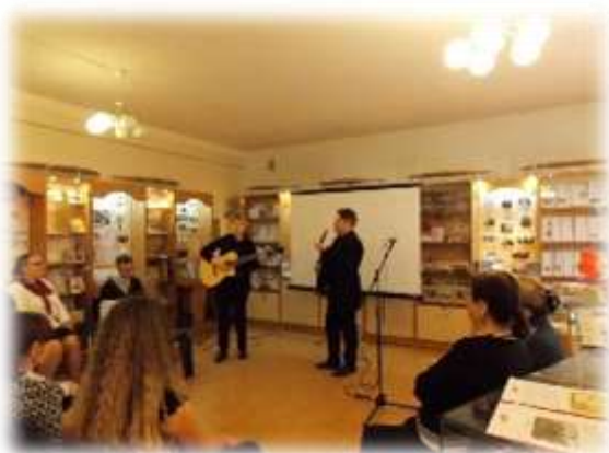
Фотографии мероприятия «Чтобы помнили»